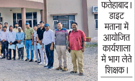
प्रशिक्षण दिया गया। इस प्रशिक्षण के पहले बैच में फतेहाबाद व रतिया के 104 टीचर्स और दूसरे बैच में भूना, जाखल, भदू और टोहाना ब्लॉक के 138 टीचर्स ने