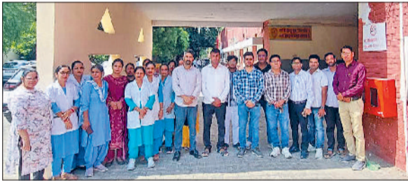
सिरसा। नागरिक अस्पताल में सरकार के खिलाफ रोष जाहिर करते स्वास्थ्य कर्मचारी।