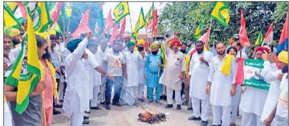
फतेहाबाद। ट्रम्प और मोदी का पुतला फूँकते किसान।