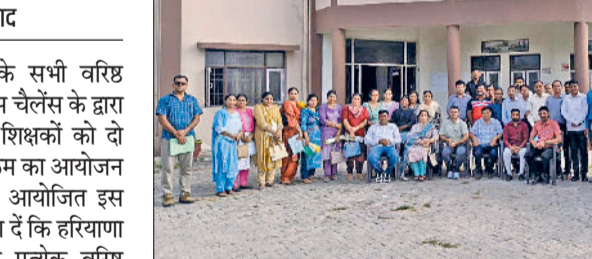
दूढ़ने वाले बनें बलिक नौकरी देने वाले भी बन सके। इस उद्देश्य की पूर्ति हेतु फतेहाबाद जिले के 121 वरिष्ठ माध्यमिक विद्यालयों में कार्यरत 242 शिक्षकों को विशेष