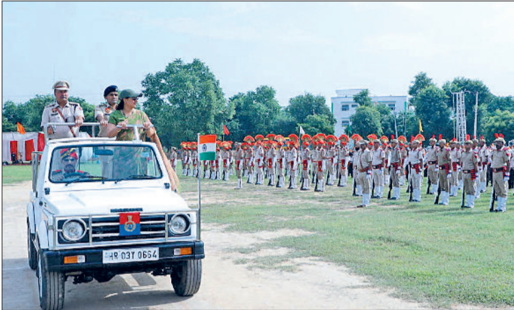
फतेहाबाद। जिला स्तरीय स्वतंत्रता दिवस समारोह की फाइनल रिहर्सल में परेड का निरीक्षण करती उपायुक्त मनदीप कौर।

15 अगस्त को होने वाले जिला स्तरीय स्वतंत्रता दिवस समारोह की तैयारियों को लेकर बुधवार को स्थानीय पुलिस लाइन ग्राउंड में भव्य फुल ड्रेस फाइनल रिहर्सल आयोजित की गई। इस अवसर पर उपायुक्त मनदीप कौर ने ठीक सुबह 9 बजे ध्वजारोहण किया और परेड का निरीक्षण किया। इससे पहले उपायुक्त मनदीप कौर ने लघु सचिवालय के समीप शहीदी स्मारक पर अमर वीर शहीदों की प्रतिमाओं पर पुष्प अर्पित कर उन्हें नमन किया। उपायुक्त मनदीप कौर ने सभी व्यवस्थाओं की बारीकी से समीक्षा की और संबंधित अधिकारियों को आवश्यक दिशा-निर्देश दिए। उन्होंने कहा कि स्वतंत्रता दिवस समारोह राष्ट्रीय गौरव और एकता का प्रतीक है, इसे भव्य और प्रेरणादायक बनाने के लिए सभी को मिलकर कार्य करना चाहिए। उपायुक्त मनदीप कौर ने बताया कि इस रिहर्सल का उद्देश्य 15 अगस्त को होने वाले मुख्य समारोह में सभी कार्यक्रमों को सुचारु रूप से संपन्न करना है। उन्होंने कहा कि सभी विभागों, पुलिस बल और स्कूलों ने पूरे उत्साह से अभ्यास किया है।