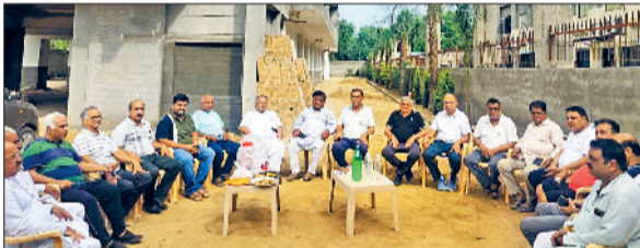
फतेहाबाद। बैठक में भाग लेते पंचनद सदस्य।

फरीदाबाद के दशहरा मैदान में मनाया जाएगा समारोह